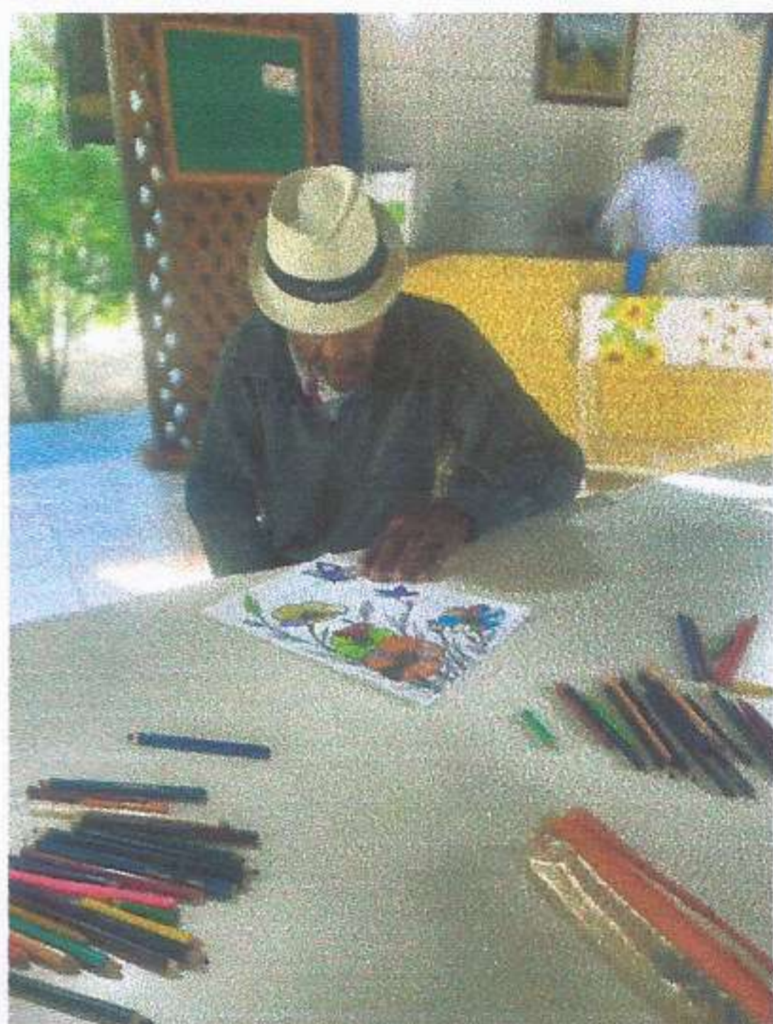
META 03: Imagem 01 ATIVIDADE ARTÍSTICA Registro fotográfico dia 02/06/2025.

Tel. (12) 3199-4424 E-mail: cmsj_larsaojose@hotmail.com