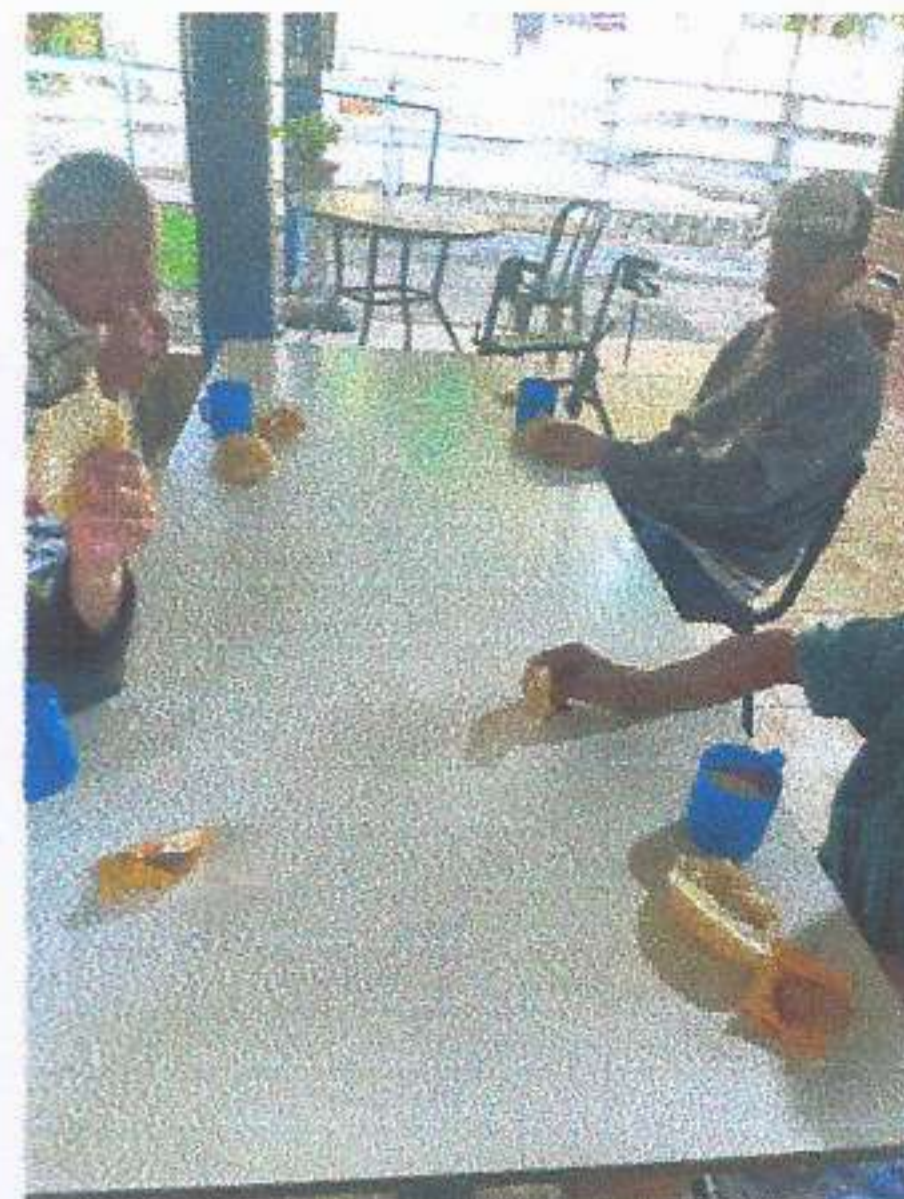
META 01: Imagem 03 NUTRIÇÃO DIA 26/06/2025

OBJETIVO ESPECÍFICO: Qualificar a oferta do serviço por meio da promoção da capacitação sistemática dos profissionais responsáveis pela oferta dos serviços.