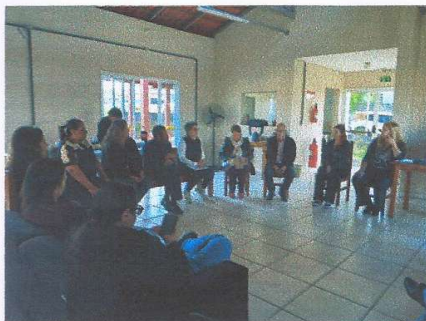
Meta 3.1 – Imagem 01 - Reunião CMDPI Realizada em 04/06/2025