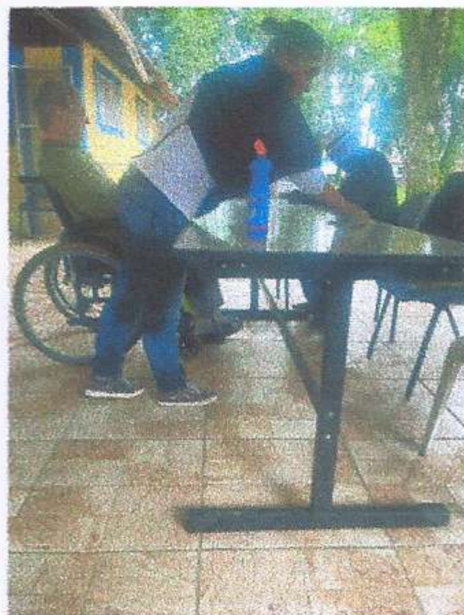
META 01: Imagem 02 HIGIENIZAÇÃO DIA 13/06/2025