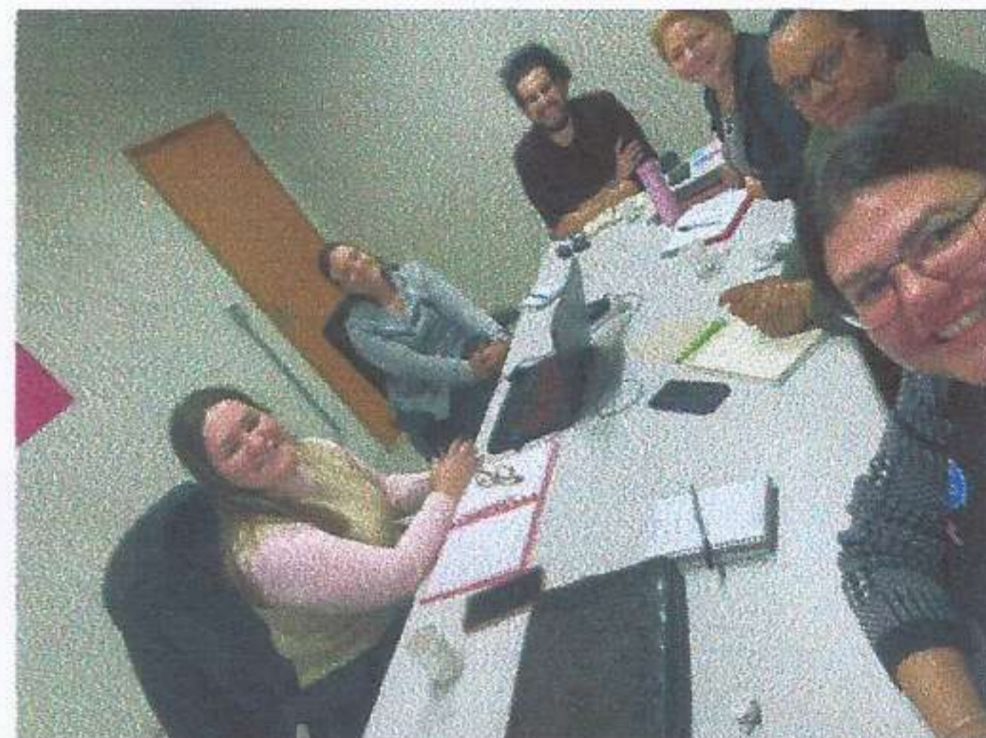
Meta 3.1 – Imagem 03 Reunião do CREAS e ILPIs Realizada em 16/06/2025

OBJETIVO ESPECÍFICO: Oportunizar o acesso às informações sobre direitos e sobre participação cidadã, estimulando o desenvolvimento do protagonismo dos usuários.