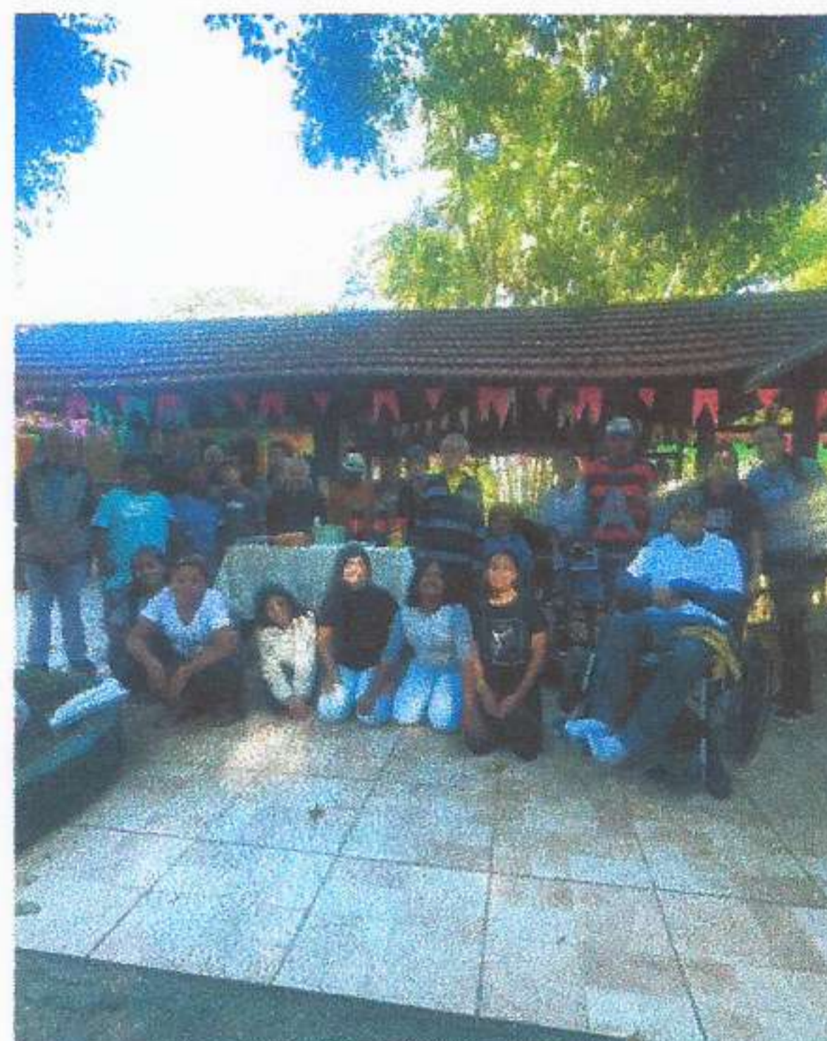
META 03: Imagem 04 ENCONTRO INTERGERACIONAL Registro fotográfico dia 18/06/2025.

OBJETIVO ESPECÍFICO: Promover o acesso a programações culturais, de lazer, de esporte e ocupacionais internas e externas, relacionando-as a interesses, vivências, desejos e possibilidades do público, bem como a convivência mista entre os residentes de diversos graus de dependência.