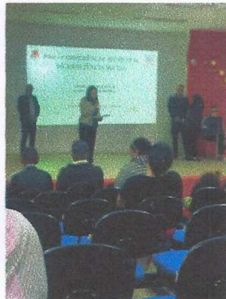
Meta 3.1 – Imagem 02 Pré-Conferência Municipal de Assistência Social Realizada em 10/06/2025