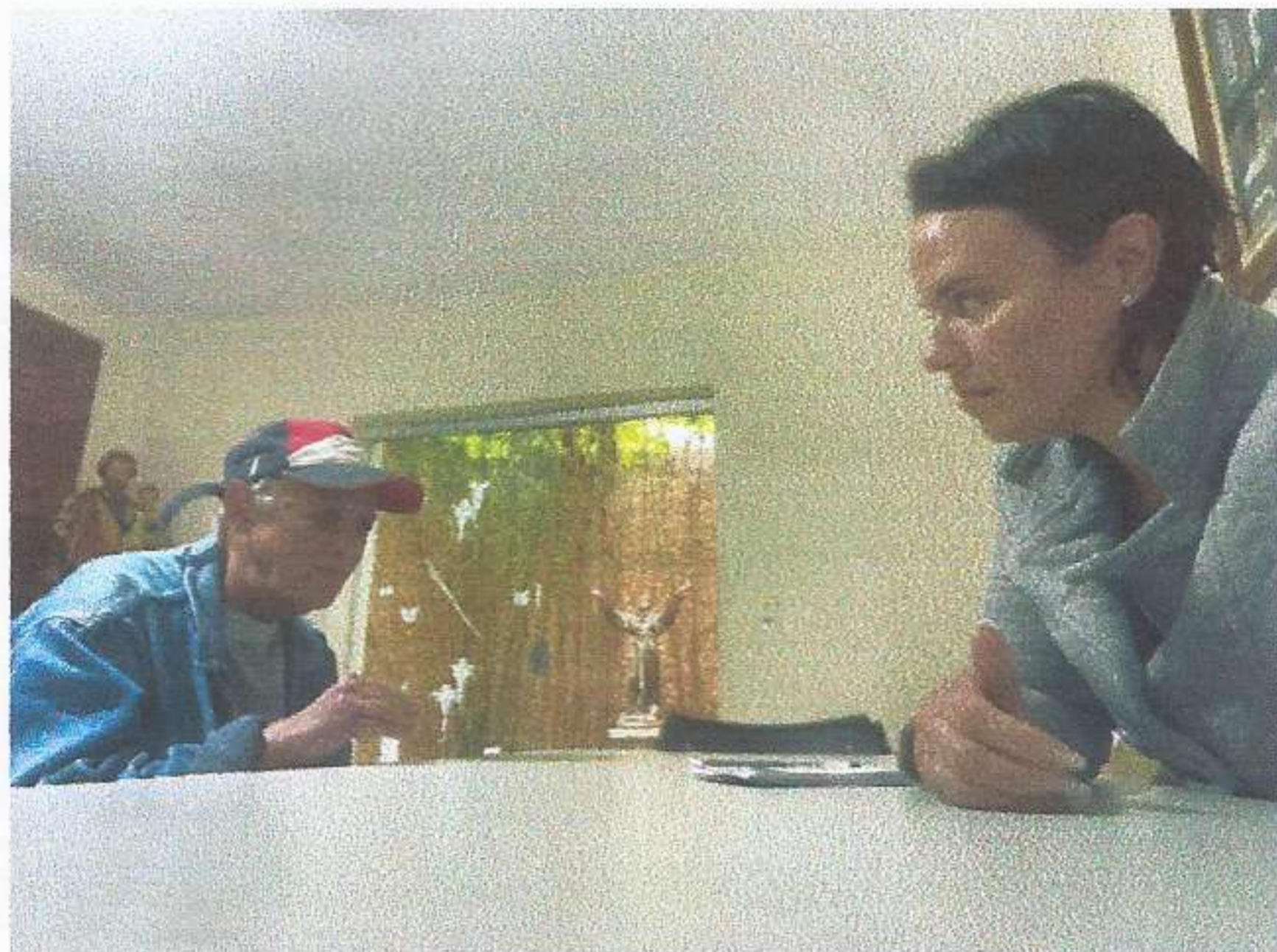
Meta 3.1 – Imagem 01 - Atendimento Realizado em 06/06/2025