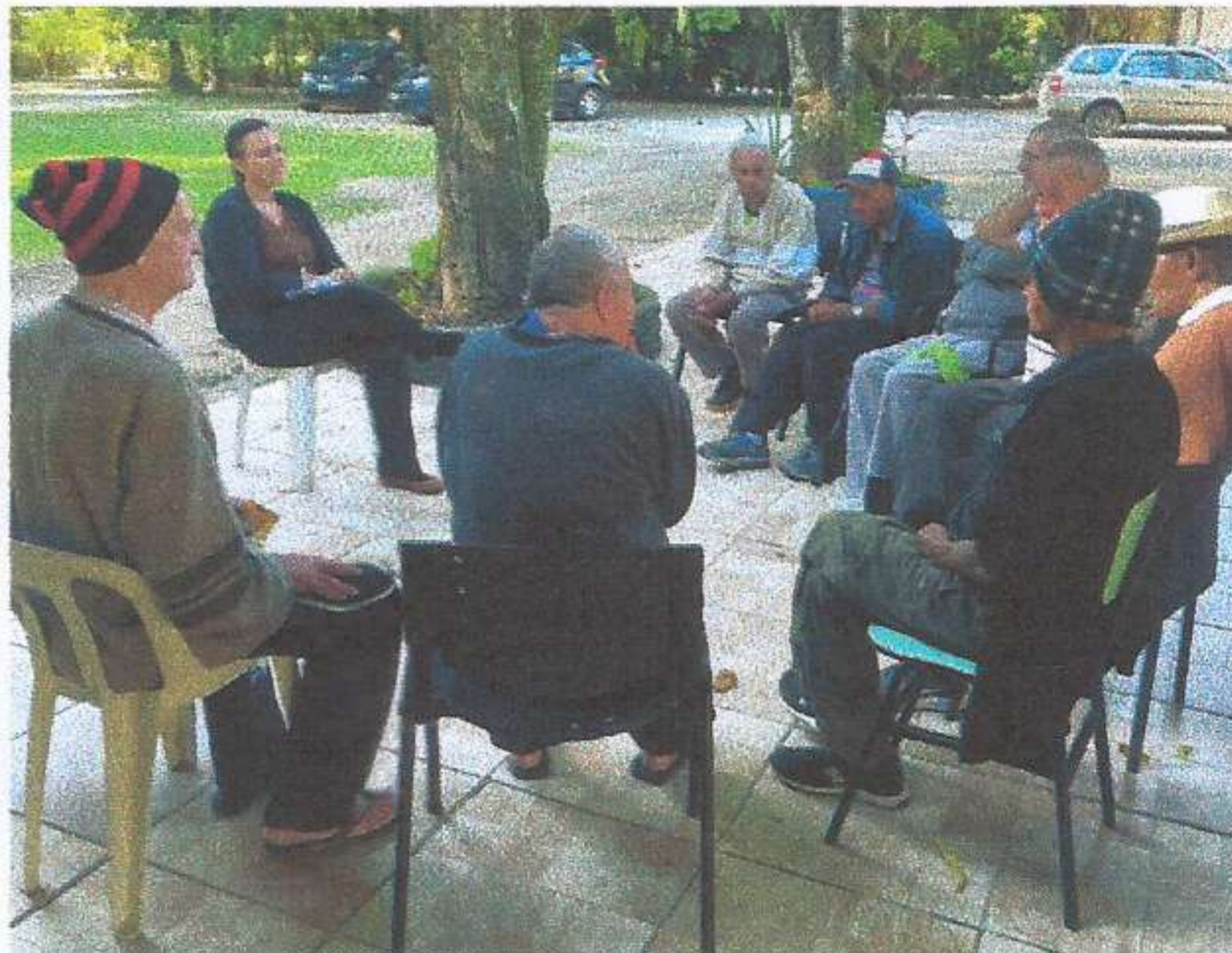
Meta 3.1 – Imagem 02 - Roda de conversa Realizada em 27/06/2025