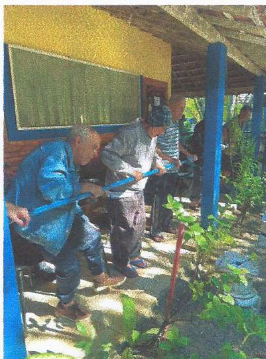
META 03: Imagem 02 ATIVIDADE FÍSICA Registro fotográfico dia 11/06/2025.