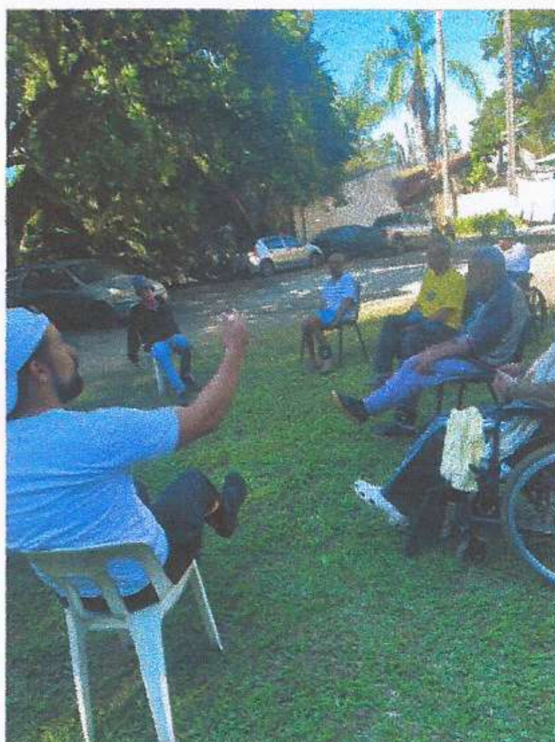
META 03: Imagem 03 ATIVIDADE FÍSICA Registro fotográfico dia 18/06/2025.