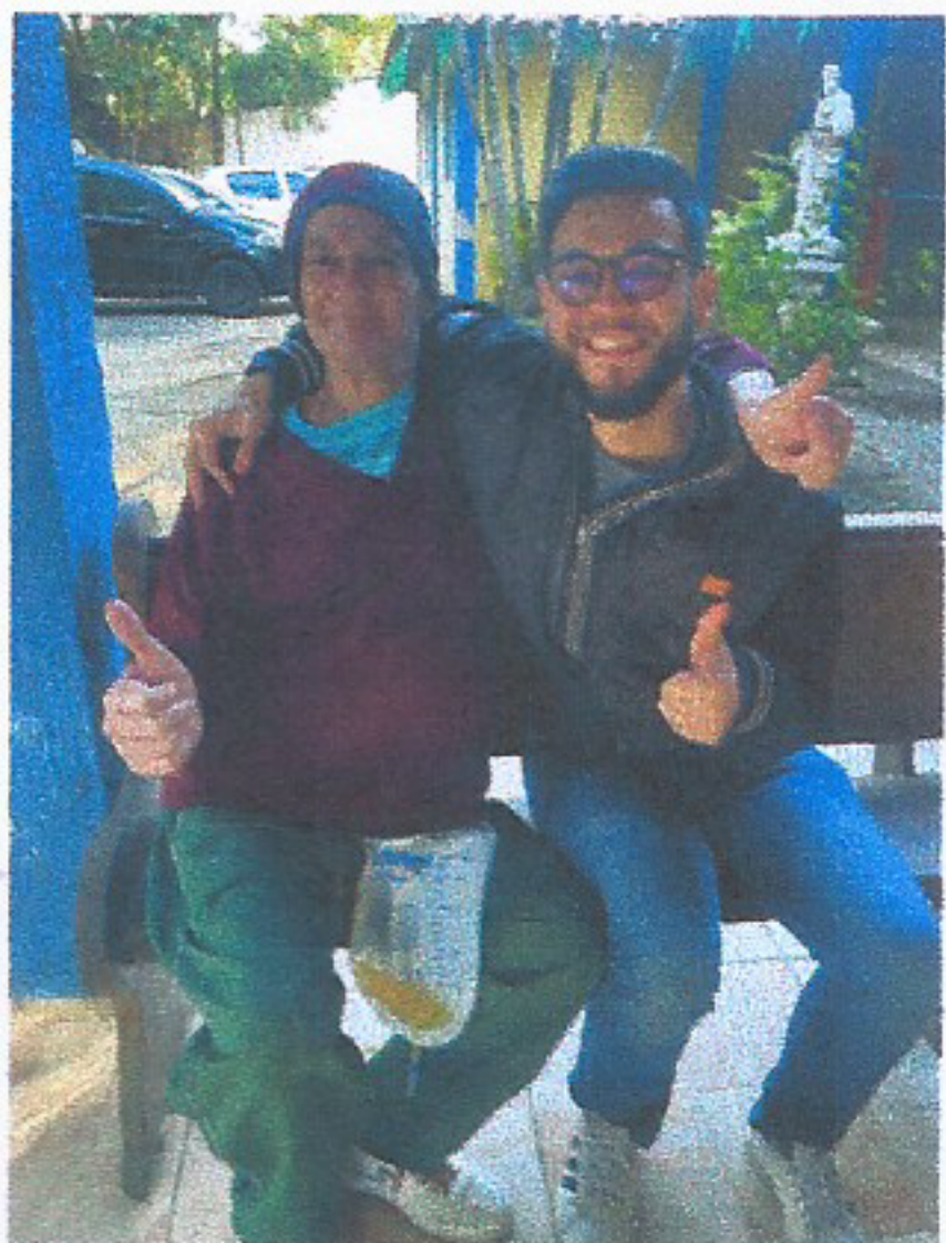
META 01: Imagem 01 VISITA FAMILIAR DIA 30/07/2025