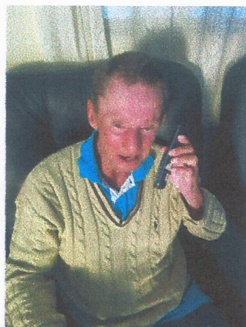
META 01: Imagem 03 LIGAÇÃO FAMILIAR DIA 25/07/2025

OBJETIVO ESPECÍFICO: Qualificar a oferta do serviço por meio da promoção da capacitação sistemática dos profissionais responsáveis pela oferta dos serviços.