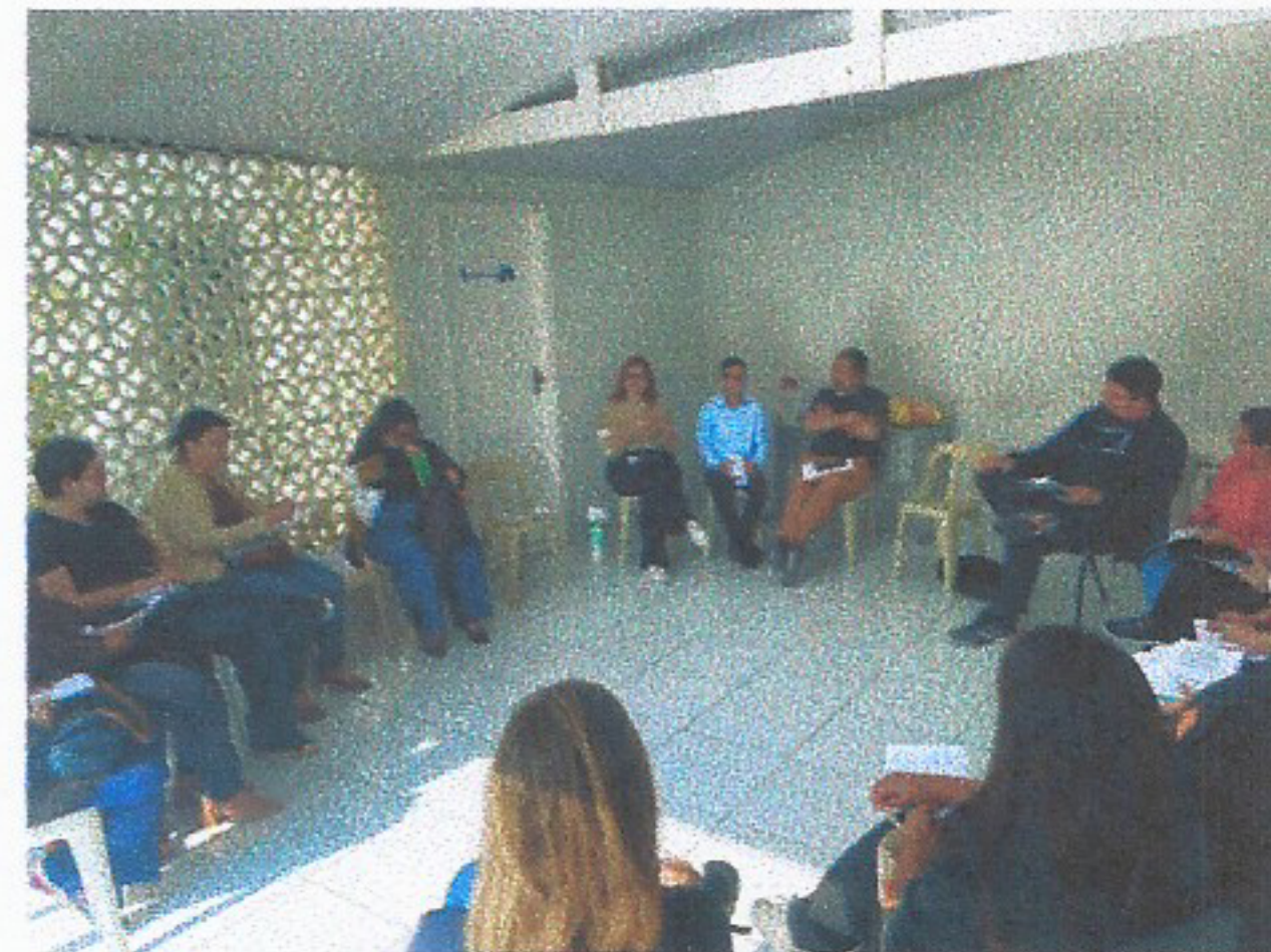
Meta 3.1 – Imagem 02 Reunião do CREAS 24/07/2025

OBJETIVO ESPECÍFICO: Oportunizar o acesso às informações sobre direitos e sobre participação cidadã, estimulando o desenvolvimento do protagonismo dos usuários.