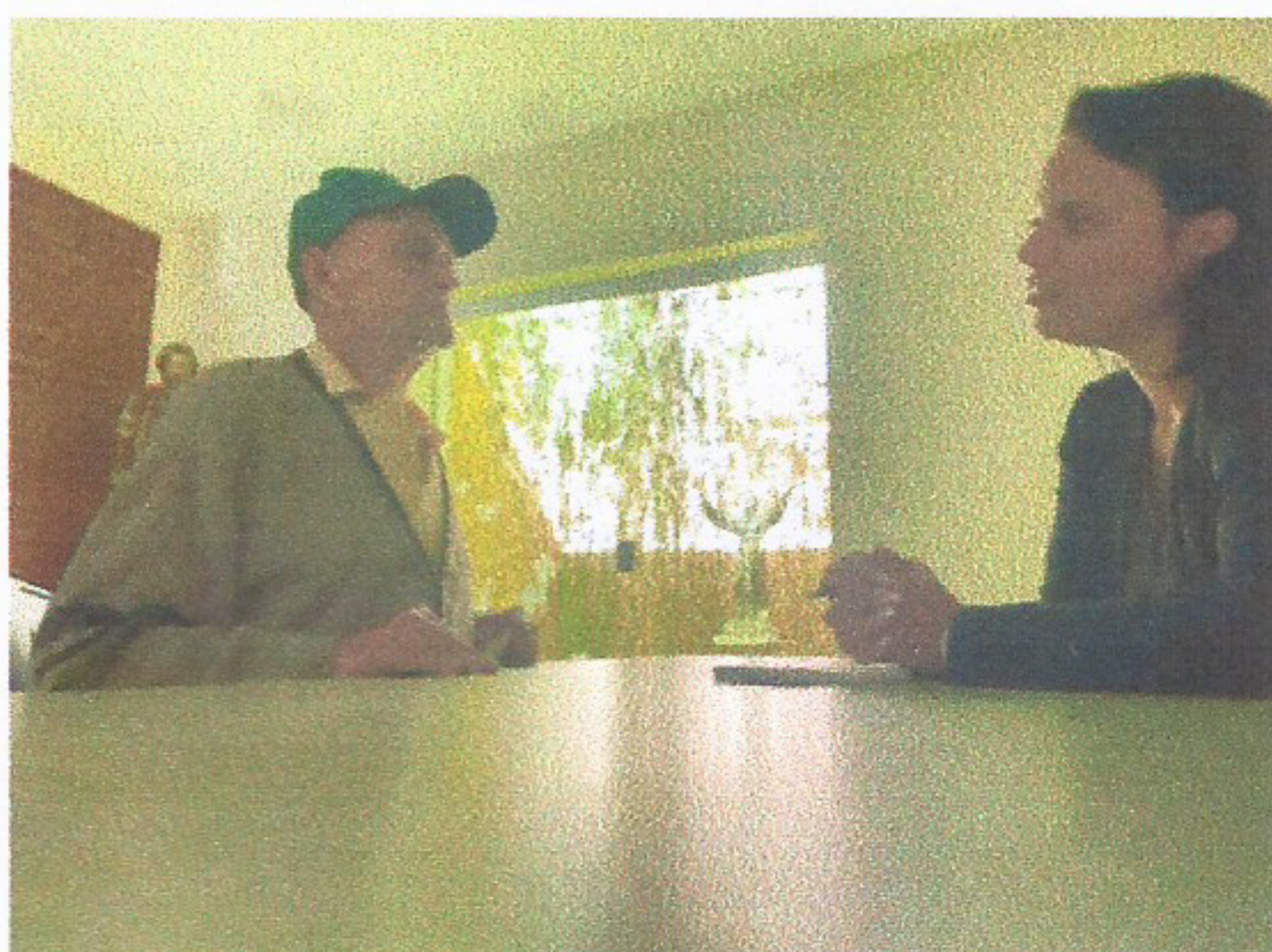
Meta 3.1 – Imagem 01 - Atendimento Realizado em 10/07/2025

Lar São José - Comunidade Missionária São José CNPJ: 04.504.217/0001-90 Rua Dr. José Nicolau Mileo, 17 – Vila Angelina-12520-150 Guaratinguetá- São Paulo. Tel. (12) 3199-4424 E-mail: cmsj_larsaojose@hotmail.com