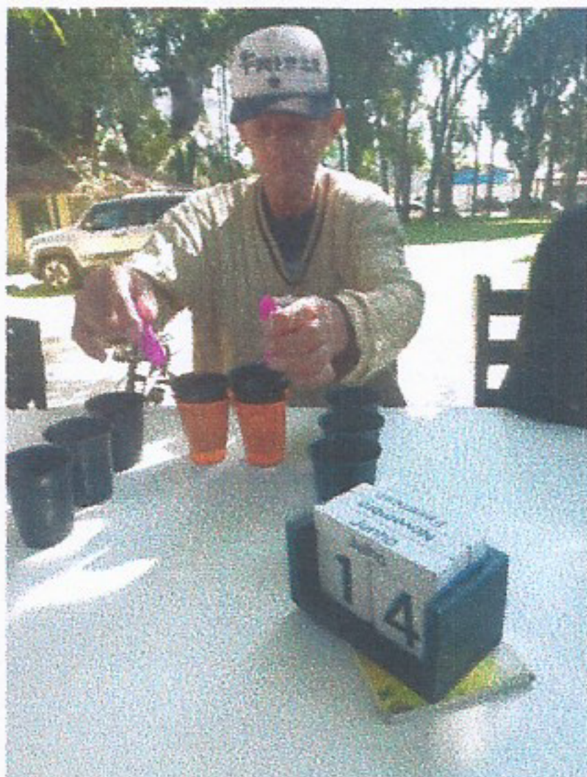
Imagem 01 ATIVIDADE LÚDICA 14/07/2025

Todas as atividades foram disponibilizadas para a participação de todos os idosos.