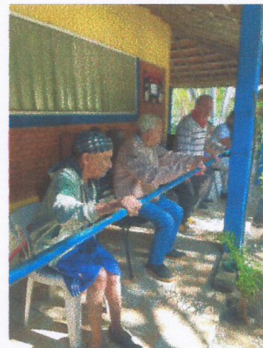
Imagem 04 ATIVIDADE FÍSICA 23/07/2025