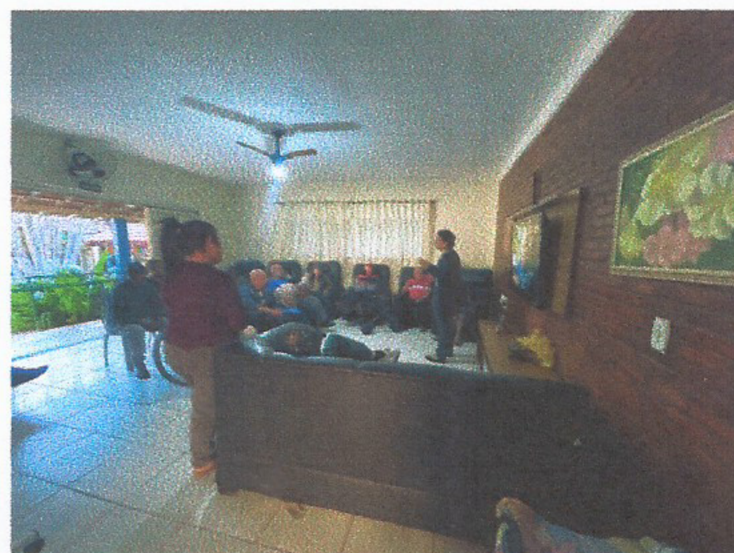
Meta 3.1 – Imagem 02 - Roda de conversa Realizada em 23/07/2025