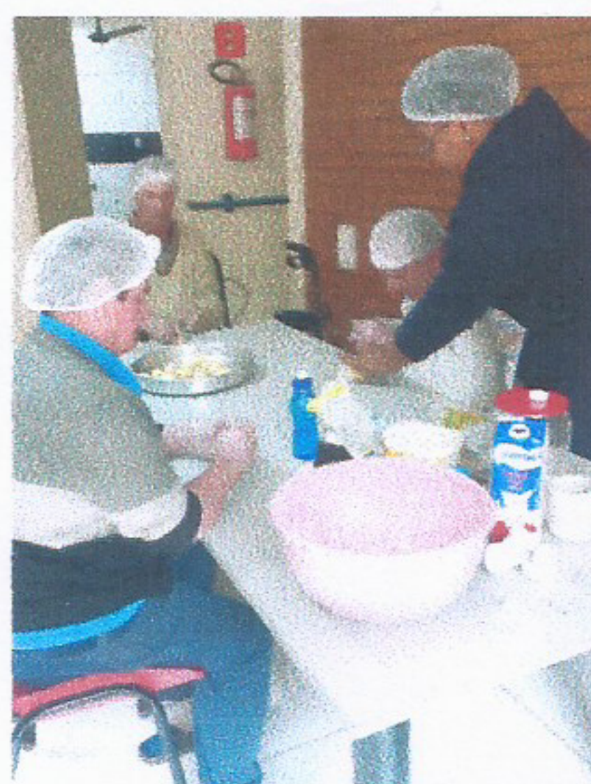
Imagem 03 ATIVIDADE CULINÁRIA 21/07/2025