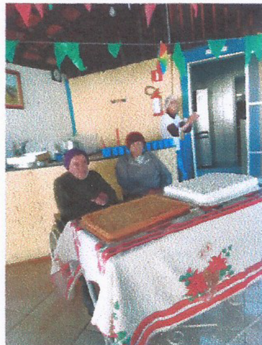
Imagem 02 ANIVERSARIANTES 28/07/2025