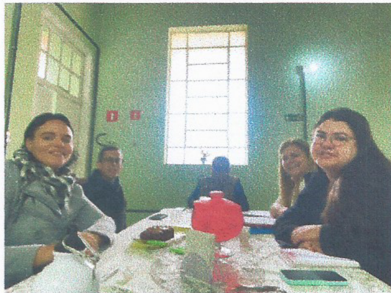
Meta 3.1 – Imagem 01 Reunião CREAS 21/07/2025

Lar São José - Comunidade Missionária São José CNPJ: 04.504.217/0001-90 Rua Dr. José Nicolau Mileo, 17 – Vila Angelina-12520-150 Guaratinguetá- São Paulo. Tel. (12) 3199-4424 E-mail: cmsj_larsaojose@hotmail.com